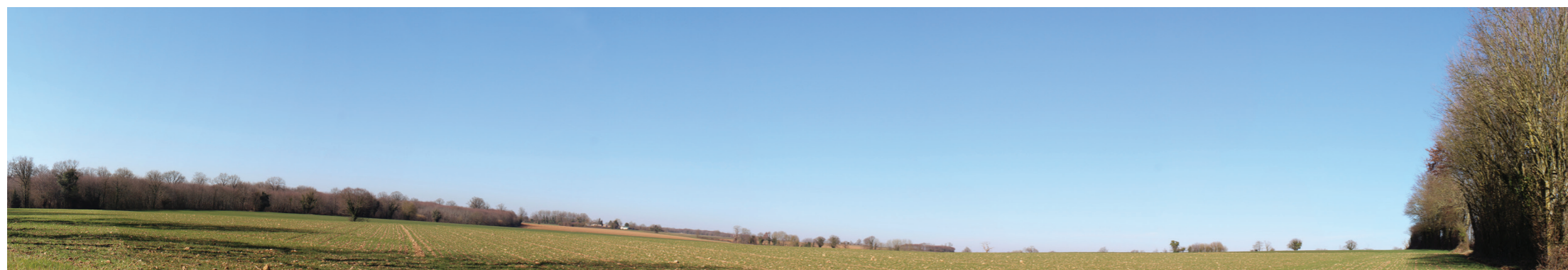
Vue panoramique de l'état initial (angle de vue 120°)