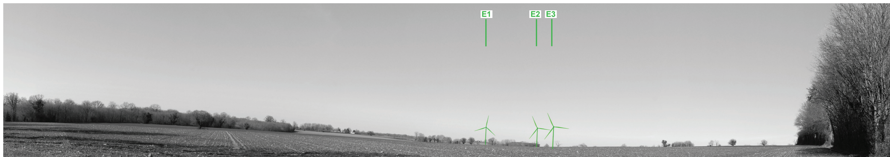
Vue panoramique noir et blanc avec esquisse du projet (angle de vue 120°)